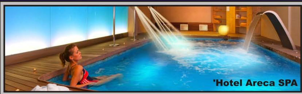
'Hotel Areca SPA